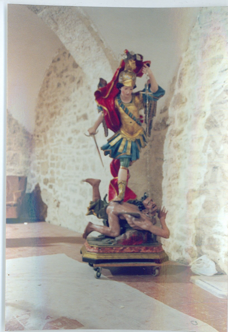
S. Angelo in Grotte (IS) Ch. di S. Pietro in Vincoli Statua lignea- dipinta e dorata sec. XVIII S. Michele – Dopo il restauro