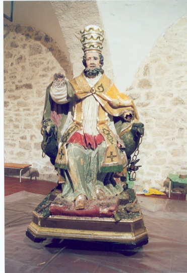
S. Angelo in Grotte (IS) Ch. di S. Pietro in Vincoli Statua lignea- dipinta e dorata (S. Pietro) Durante la pulitura