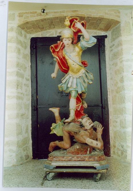
S. Angelo in Grotte (IS) Ch. S. Pietro in Vincoli Statua lignea – dipinta e dorata sec. XVIII S. Michele e il drago – Saggi di pulitura