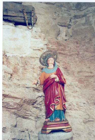
S. Angelo in Grotte (IS) Ch. di S. Pietro in Vincoli Statua lignea- dipinta e dorata Dopo il restauro