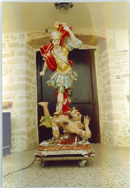
S. Angelo in Grotte (IS) Ch. S. Pietro in Vincoli Statua lignea – dipinta e dorata sec. XVIII S. Michele e il drago – Stuccatura