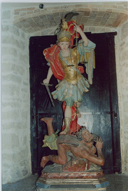
S. Angelo in Grotte (IS) Ch. di S. Pietro in Vincoli Statua lignea- dipinta e dorata sec. XVIII S. Michele - Prima del restauro