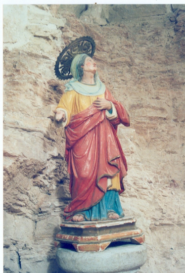
S. Angelo in Grotte (IS) Ch. di S. Pietro in Vincoli Statua lignea- dipinta e dorata Prima del restauro